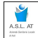
Azienda Sanitaria Locale di Asti