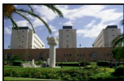
University "G. D'Annunzio" Chieti - Pescara Dental School